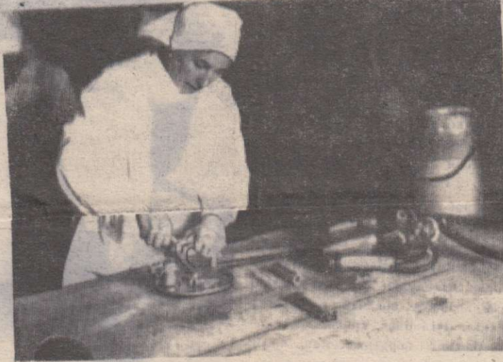
Собрать и разобрать в считанные минуты доильный агрегат — большое искусство.

Флаг медленно ползет по флашгоке. Весенний ветер треплет красное полотнище. Соревнование начато. Расходятся по своим местам члены