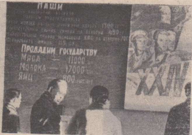
вверху) рассказал корреспонденту ТАСС А. Овчинникову, что такой рост производственных показателей достигнут коллективом, в авангарде которого идут 180 коммунистов. Партком стал настоящим

одного из стендов, рассказывающих о предсезонных обязательствах коллектива.