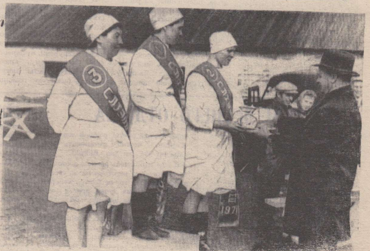
На пьедестал почета поднялись лучшие из лучших.